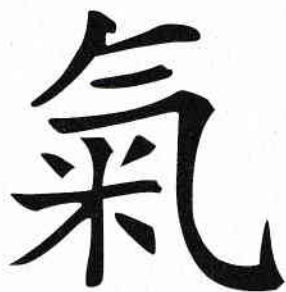
Figura 1.1 (Qi)

Caracterul chinezesc pentru Qi (Figura 1.1) reprezintă un bol cu orez, cu aburul care se degajă deasupra orezului. Această pictogramă conține o bogăție de informații. În medicina chineză și în gândirea științifică, filosofică și spirituală chineză se consideră că Qi este atât forța motrice, cât și fundamentul material, substanța de bază a universului, așa cum am prezentat-o mai sus.